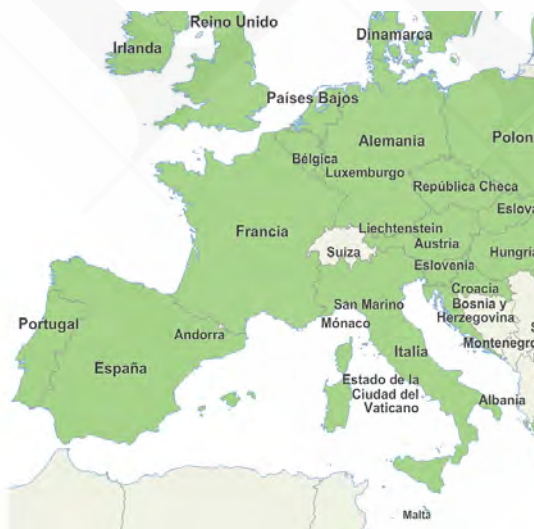
Países miembros de la Unión Europea 2017 3

Por otra parte, “el Tratado de Lisboa ofrece a los ciudadanos una participación más directa en el proceso de toma de decisiones de la Unión Europea. Por ejemplo, [...] crea la iniciativa ciudadana europea, por la que un millón de ciudadanos, de un número significativo de Estados miembros, puede proponer directamente a la Comisión Europea que presente legislaciones en ciertos ámbitos de competencia de la UE” 2 .